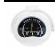
Lateral / Lateral